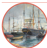
Guglielmo Micheli, Porto di Livorno (Museo Fattori) - Via Enrico Cialdini