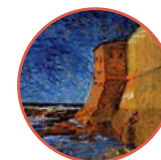
Mario Puccini, Torre del Lazzeretto ( coll. privata) - Scogli dell' Accademia - Adottato dal Gruppo Labronico