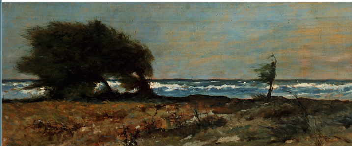
GIOVANNI FATTORI (1825 - 1908) La Libeccciata , olio su tavola, 28,4 x 68 cm, 1880 e 1885 circa, Palazzo Pitti - Galleria d'arte moderna di Firenze, Firenze.