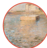
Alfredo Muller - Sole d'Aprile (Fondazione Tortona) - Terrazza Mascagni