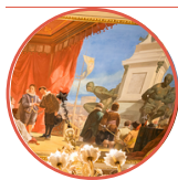
Annibale Gatti, L'inaugurazione dei Quattro Mori (Museo Fattori) - Quattro Mori