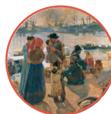
Raffaello Gambogi, Emigranti (Museo Fattori) - Andana degli Anelli